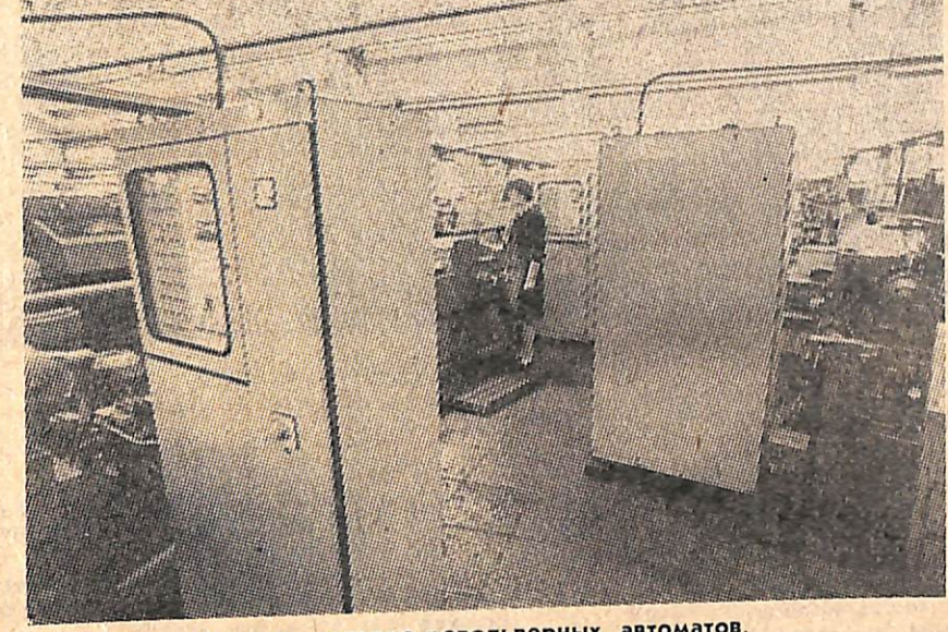
Участок токарно-револьверных автоматов.