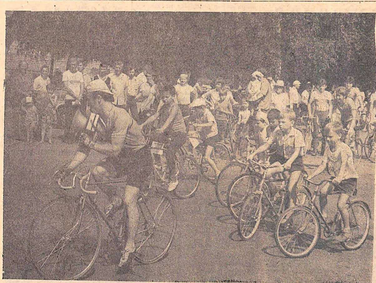
Воспоминания о лете.